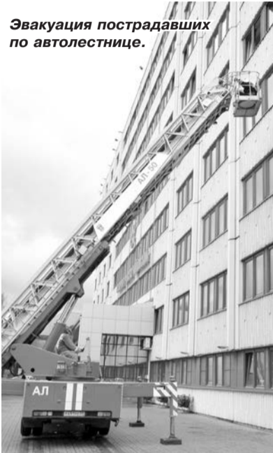
Эвакуация пострадавших по автолестнице.

Уже через несколько минут пожарные расчёты и службы экстренной помощи прибыли на место происшествия.