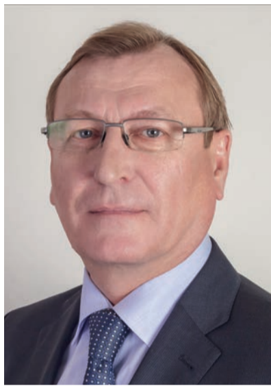
(Окончание. Начало на 1 стр.)

Ключевой темой нынешней встречи стал посыл краевого руководства к исполнительной и представительной власти – к объединению.