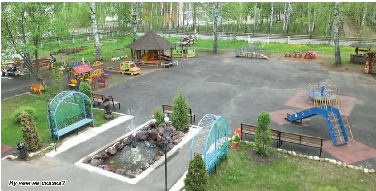
Ну чем не сказка?