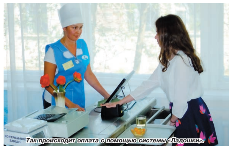
Так происходит оплата с помощью системы «Ладочки»