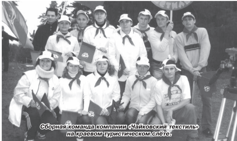
Сборная команда компании «Чайковский текстиль» на краевом туристическом слёте.

Каждое предприятие славится своими традициями. Годами отстраиваемая система взаимодействия внутри коллектива и в целом в обществе – залог крепкого настоящего и надёжного будущего. «Чайковскому текстилю» – предприятию с 55-летней (!) историей – традиций не занимать: начиная с производства качественных и востребованных на современном рынке тканей и заканчивая организацией досуга своих работников. Чайковские текстильщики всегда умели и трудиться на славу, и отдыхать с пользой.