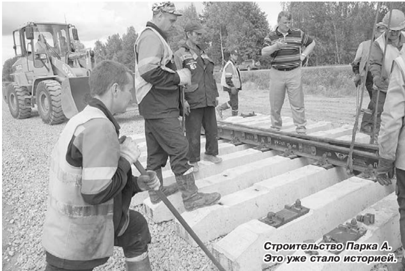
Строительство Парка А. Это уже стало историей.