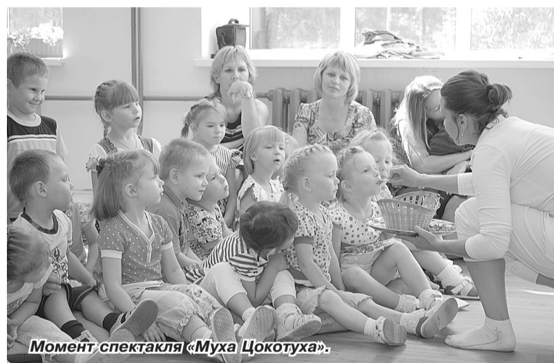
Момент спектакля «Муха Цокотуха».