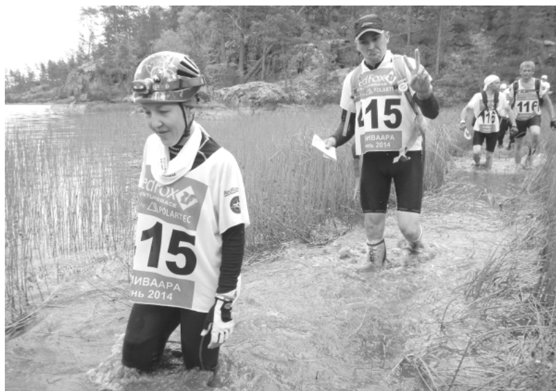
Восемнадцатый день болота...