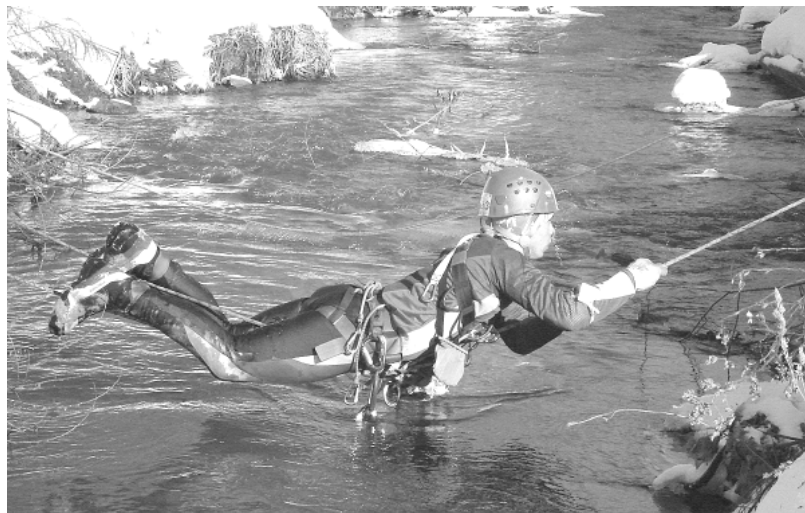
Не замочив ног.

В настоящее время СДЮТЭ является центром детско-юношеского туризма Чайковского района. В учреждении успешно функциониру-