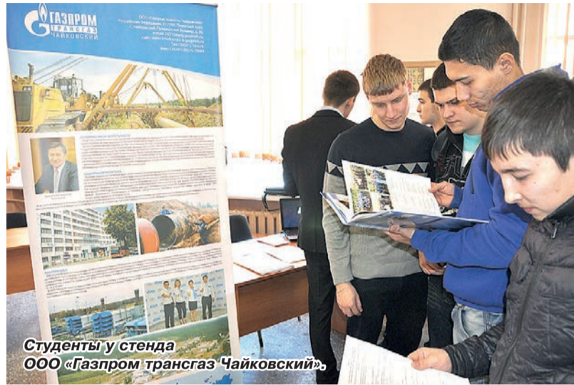
Студенты у стенда ООО «Газпром трансгаз Чайковский».

В этот раз представители КНИТУ презентовали «Газпрому» свои научно-исследовательские и опытно-конструкторские проекты, перспективные для внедрения на производственных объектах компании. Затем состоялось торжественное открытие лаборатории