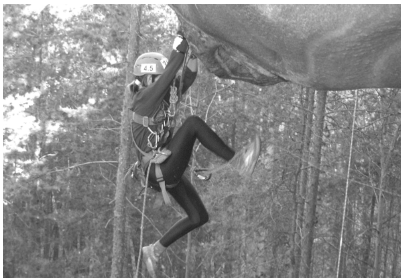
Не Эверест, конечно, но...

ет 100 детских объединений дополнительного образования, в которых занимается более 1500 воспитанников в возрасте от 7 до 18 лет.