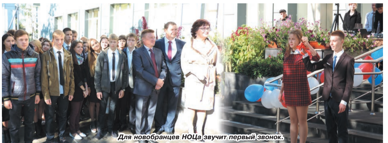
Для новобранцев НОЦа звучит первый звонок.

По традиции очень красочно проходила торжественная линейка в Новом образовательном центре, который в этом году отметил первую пятилетку со дня своего основания.