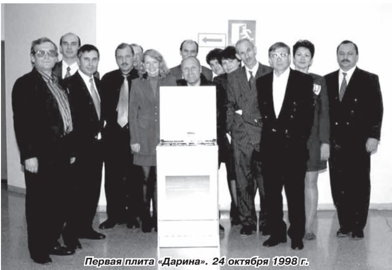
Первая плита «Дарина». 24 октября 1998 г.