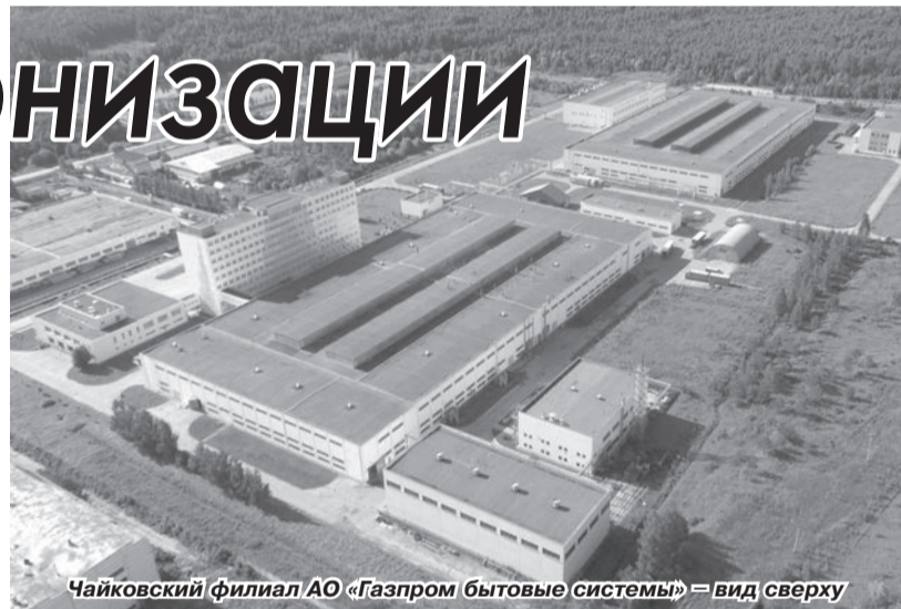
Чайковский филиал АО «Газпром бытовые системы» – вид сверху

Также на предприятии всегда есть своя социальная жизнь – проводится масштабный перечень мероприятий, начиная со спортивных соревнований и заканчивая подве-