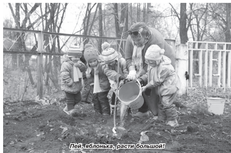
Пей, яблонька, расти большой!

– Сегодняшнее мероприятие трудно назвать посадкой сада. Это капля участия нас, взрослых, в непростой жизни этих ребят, оставшихся без попечения родителей. Надеюсь, что этот день пода-