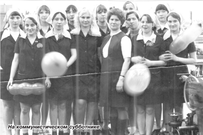
На коммунистическом субботнике

29 октября наша страна будет отмечать знаменательную дату – 100-летие Всесоюзного Ленинского коммунистического союза молодёжи (ВЛКСМ). Для многих из нас, ветеранов комсомола, этот день остаётся праздником. С ним связаны наши воспоминания о комсомольской юности, которая была овеяна романтикой тех лет, творческим поиском, энтузиазмом, стремлением строить настоящее и будущее.