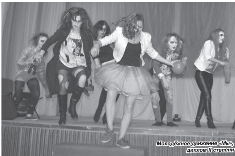
Молодёжное движение «Мы», диплом III степени

нынешний лауреат, «золотой голос» «Уралоргсинтеза». В одном ряду с нею – «серебряные» дипломанты «Формулы успеха – 2015»: участницы группы «Позитивный квинтет» и молодёжного объединения «Мы». Всполохами «бронзы» озагорилось выступление ансамбля «Но-