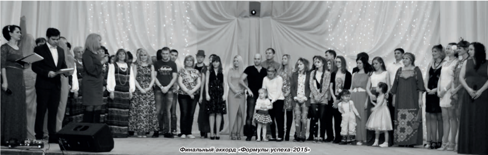
Финальный аккорд «Формулы успеха-2015»