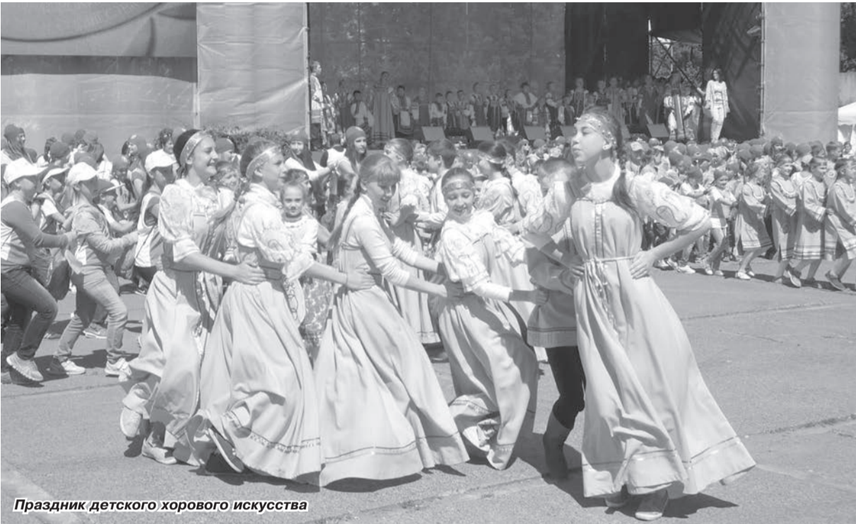
Праздник детского хорового искусства