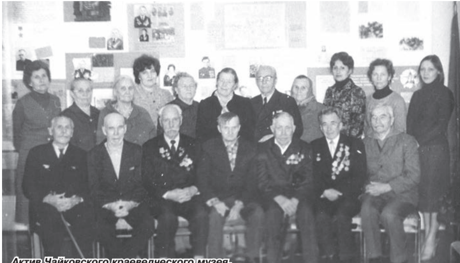
Актив Чайковского краеведческого музея, ноябрь 1982 года

Музей был открыт в 1963 году. Первые 15 лет он работал как народный – на общественных началах. Исследовательской, собирательской и экспозиционно-выставочной деятельностью занимались организаторы и создатели музея – общественники из числа пенсионеров. Средний возраст активистов народного музея составлял на ту пору 65 лет! Несмотря на столь почтенный возраст, ветераны сумели сформировать первые коллекции, вели большую экспозиционную и пропагандистскую работу.