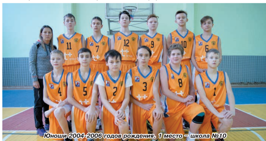
Юноши 2004-2006 годов рождения, 1 место – школа №10

В Чайковском прошёл 2 этап чемпионата Школьной баскетбольной лиги «КЭС-БАСКЕТ» среди команд общеобразовательных учреждений сезона 2018-2019 годов.