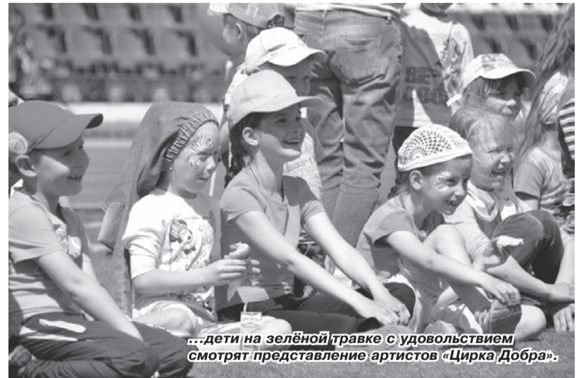
...дети на зелёной травке с удовольствием смотрят представление артистов «Цирка Добра».

Газовики демонстрировали свою спортивную подготовку в беге на 100 м, прыжке в длину с места, подтягивании на высокой и низкой пе-