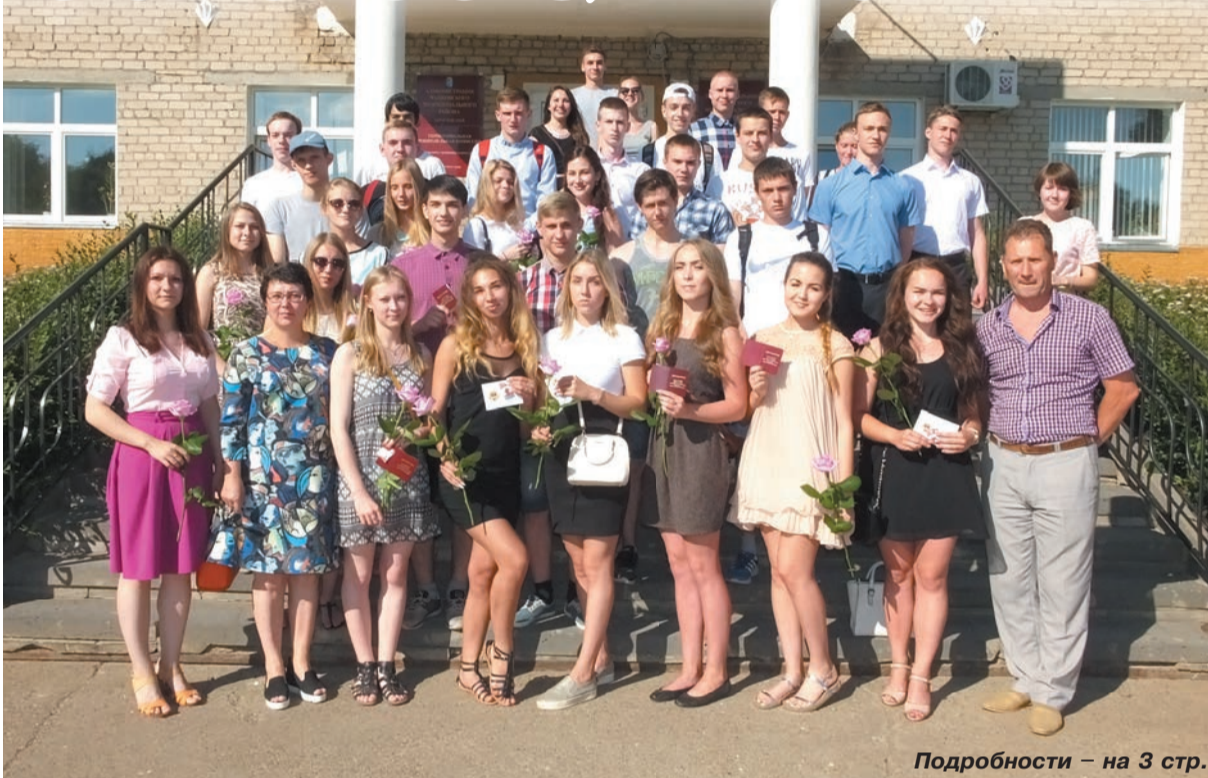
Подробности – на 3 стр.