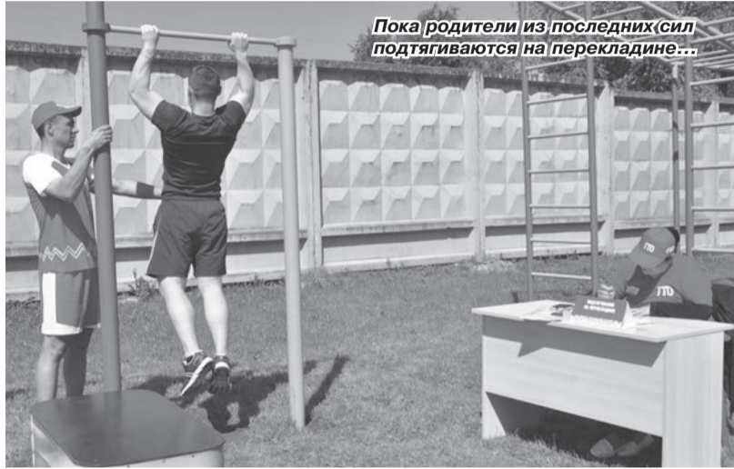
Пока родители из последних сил подтягиваются на перекладине...

В первый месяц лета на стадионе «Энергия» Культурно-спортивного центра газовиков состоялся грандиозный спортивный праздник «Навстречу ГТО». Благодаря инициативе объединённой профсоюзной организации и поддержке руководства предприятия, газвики и члены их семей получили уникальную возможность пройти тестовое выполнение норм комплекса «Готов к труду и обороне», а также весело провести субботний день.