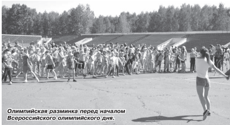
Олимпийская разминка перед началом Всероссийского олимпийского дня.