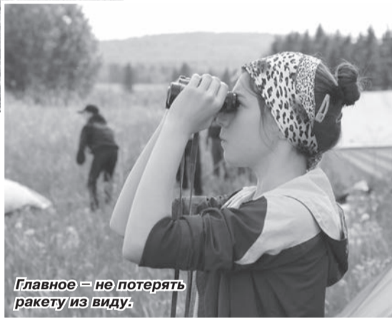
Главное – не потерять ракету из виду.