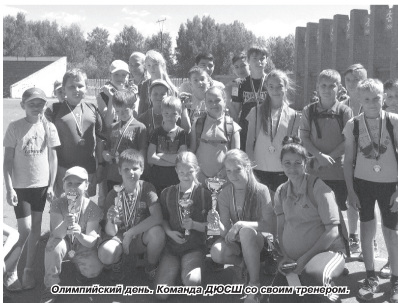
Олимпийский день. Команда ДЮСШ со своим тренером.