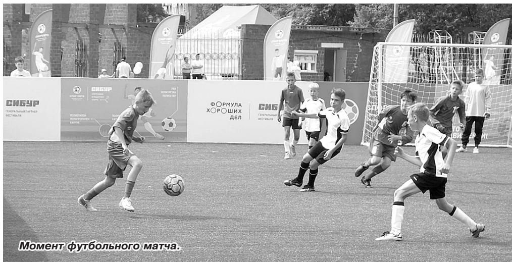
Момент футбольного матча.

Я занимаюсь с мальчишками. Наверное, кто-то подумал, что я научу юных чайковских футболистов такому, что завтра они станут играть, как Пеле, попадут в знаменитые клубы и будут получать миллионы. Нет! Главное, что мы смогли пообщаться, обсудить, дети между собой поиграли.