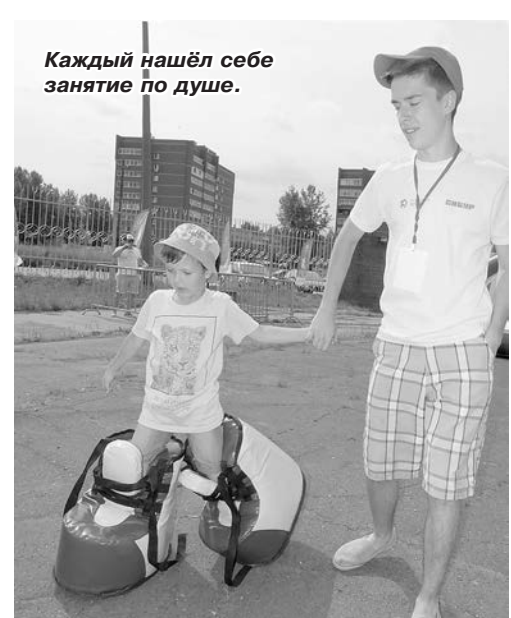
Каждый нашёл себе занятие по душе.

– Администрация города не первый год сотрудничает с компанией СИБУР и предприятием «Уралоргсинтез», которые уделяют большое внимание реализации социальных проектов на нашей территории. Нам есть чем гордиться: недавно в ходе реализации совместного проекта была открыта детская площадка имени Веры Александровны Волковой. Сейчас сооружается сквер в Заринском микрорайоне. Есть проекты в сфере развития культуры, спорта. Мы