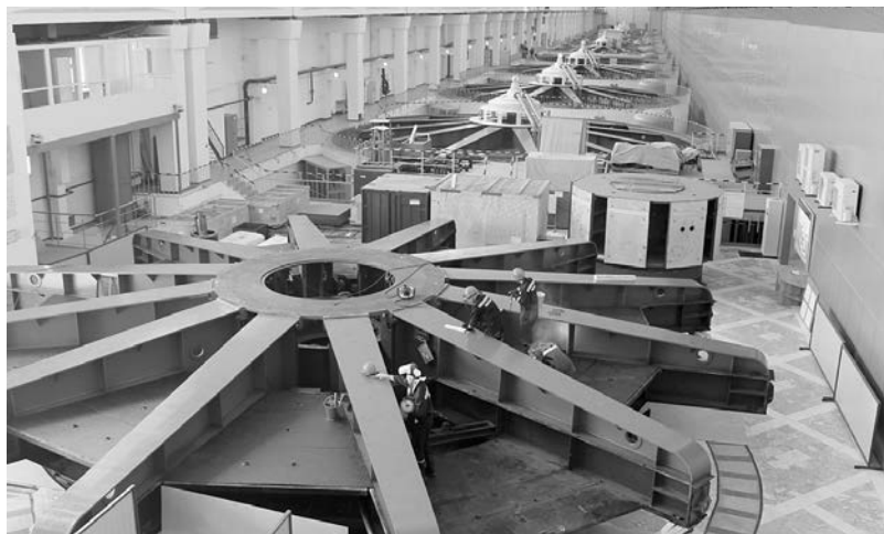
Работы на монтажной площадке машинного зала станции.