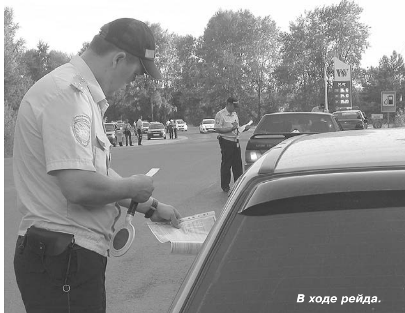
В ходе рейда.

вели с водителями профилактические беседы, разъяснили ответственность за совершение административных правонарушений в области безопасности дорожного движения.