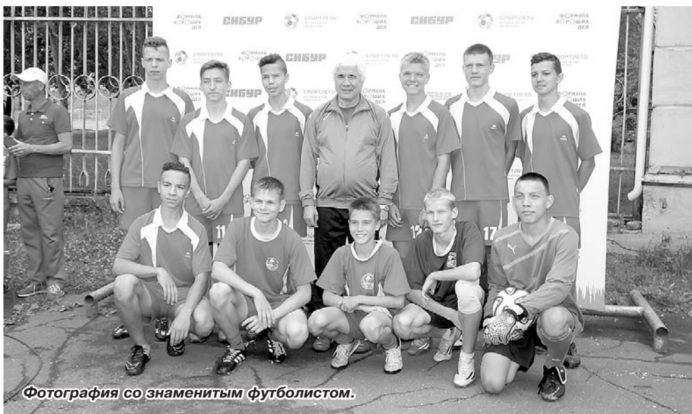
Фотография со знаменитым футболистом.

Мастер-классы футбольного маэстро для юных футболистов прошли на «ура». Мальчишки занимались увлечённо, заинтересованно, ловили каждое слово опытного наставника. Всё-таки магия имён имеет место – наставления знаменитого футболиста и тренера воспринимались юными футболистами по-особенному и, будем надеяться, семена упали в благодатную почву. Наряду со специальными упражнениями мальчишки с Евгением Ловчевым играли в игры, которые в своё время широко практиковались и в секциях по самым разным видам спорта: им мальчишки с упоением отдавались и просто на улицах. Подвижные игры на свежем воздухе – так это называлось в советское время – приносили огромную пользу и в плане физического развития, и укрепления духа. Закаляли и ориентировали на победу.