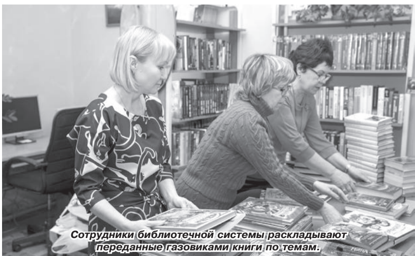
Сотрудники библиотечной системы раскладывают переданные газовиками книги по темам.

14 февраля в Международный день книгодарения работники ООО «Газпром трансгаз Чайковский» передали для пополнения фондов детских библиотек Чайковского городского округа более ста пятидесяти детских книг. Книги были собраны газовиками в рамках благотворительной акции «Новая книга библиотеке».