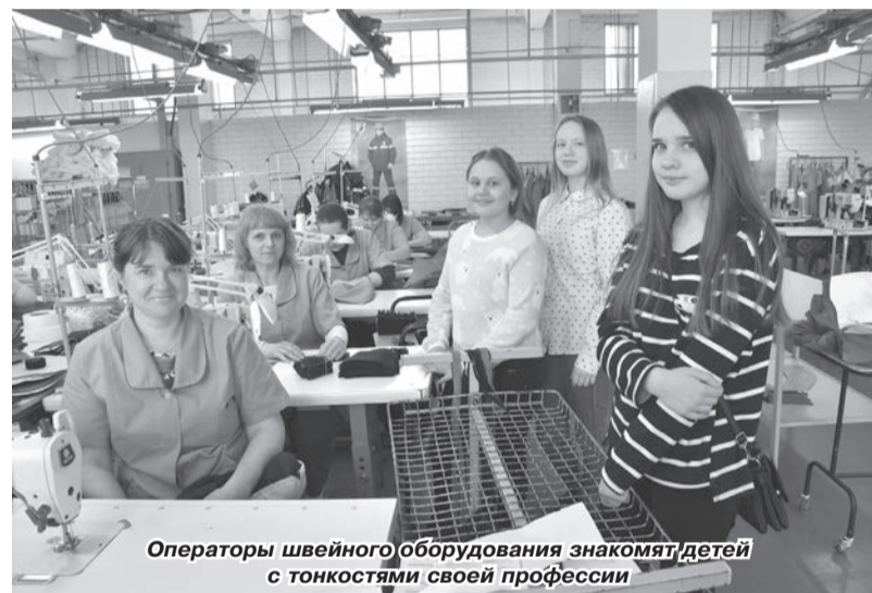
Операторы швейного оборудования знакомят детей с тонкостями своей профессии