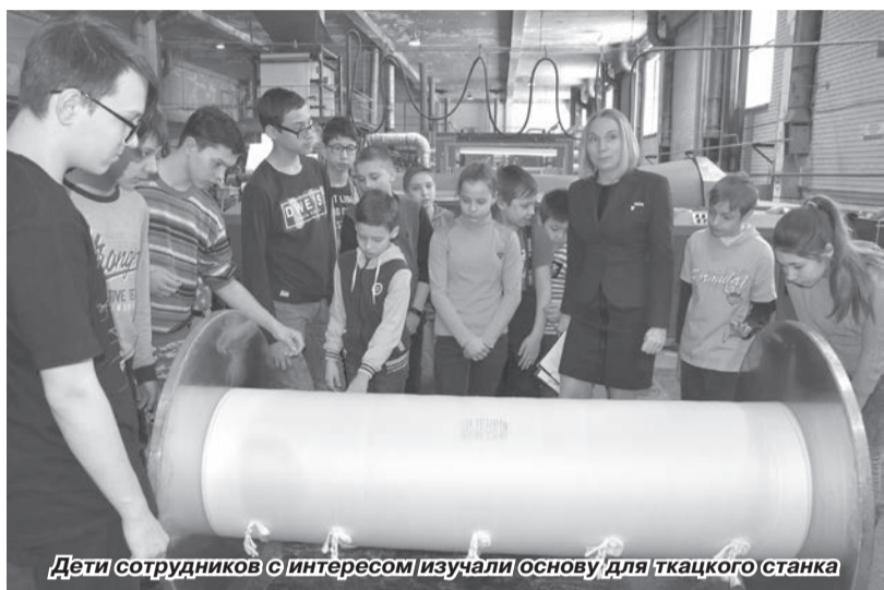
Дети сотрудников с интересом изучали основу для ткацкого станка

Тридцатого марта в компании «Чайковский текстиль» состоялся День открытых дверей. Во время школьных каникул пятьдесят детей сотрудников посетили производство чайковских тканей, а также увидели рабочие места родителей. Мероприятие прошло в рамках Всероссийской акции «Неделя без турникетов».