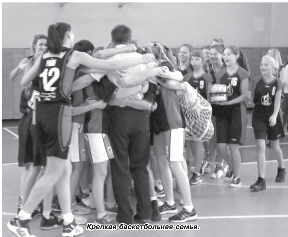
Крепкая баскетбольная семья.