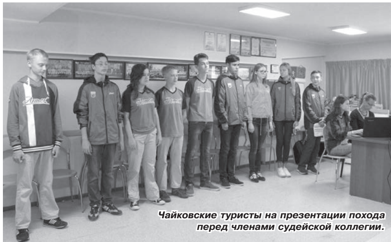
Чайковские туристы на презентации похода перед членами судейской коллегии.

ших – второе место из шестнадцати в номинации «Полевые маршрутные экспедиции»! А потом и ещё один приятный сюрприз: призёрам конкурса полагается 10 путёвок в «Артек», чтобы очно представить свой маршрут на суд профессионального жюри.