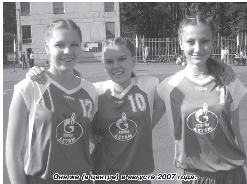
Она же (в центре) в августе 2007 года.

– О! Баскетбол – игра просто замечательная! Баскетбол – это ответственность и разнообразие движений, положенных в его основу, как, например, бег, прыжки, броски, пе-