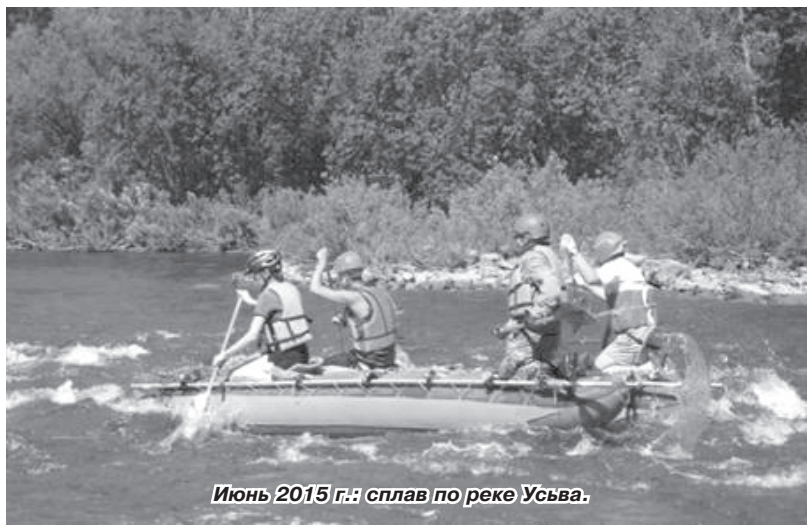
Июнь 2015 г.: сплав по реке Усьва.

Мечта всех советских мальчишек и девчонок сбылась у обычных чайковских школьников. В середине октября десять восьмиклассников из школы № 10, занимающихся на Станции детского, юношеского туризма и экологии (СДЮТЭ), вернулись из международного детского центра «Артек», где защищали честь родной территории на Всероссийских соревнованиях спортивных походов и экспедиций обучающихся.