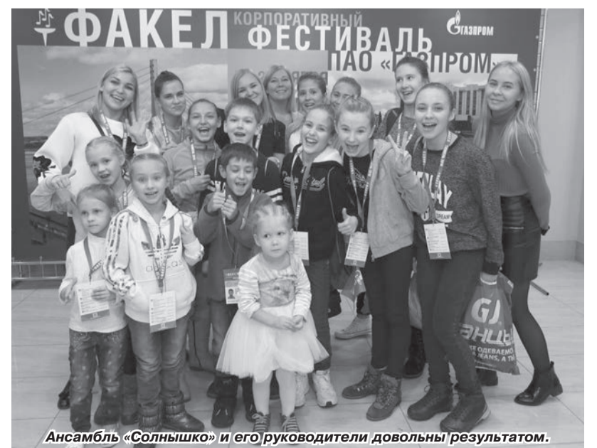
Ансамбль «Солнышко» и его руководители довольны результатом.