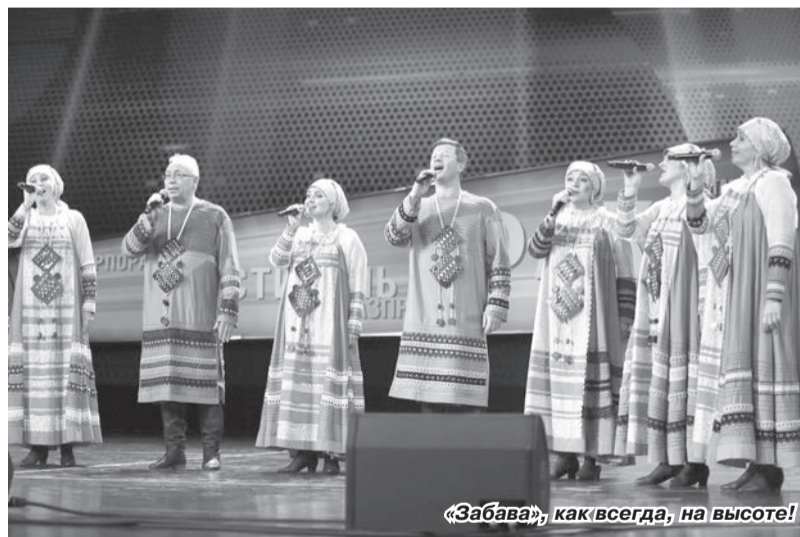
«Забавы», как всегда, на высоте!

К слову, о жюри. Его состав на фестивале – всегда высочайшего уровня. Жюри возглавляет народная артистка России, лауреат премии Правительства Российской Федерации, член Президиума Совета при Президенте Российской Федерации по культуре и искусству, профессор, руководитель Государственного академического