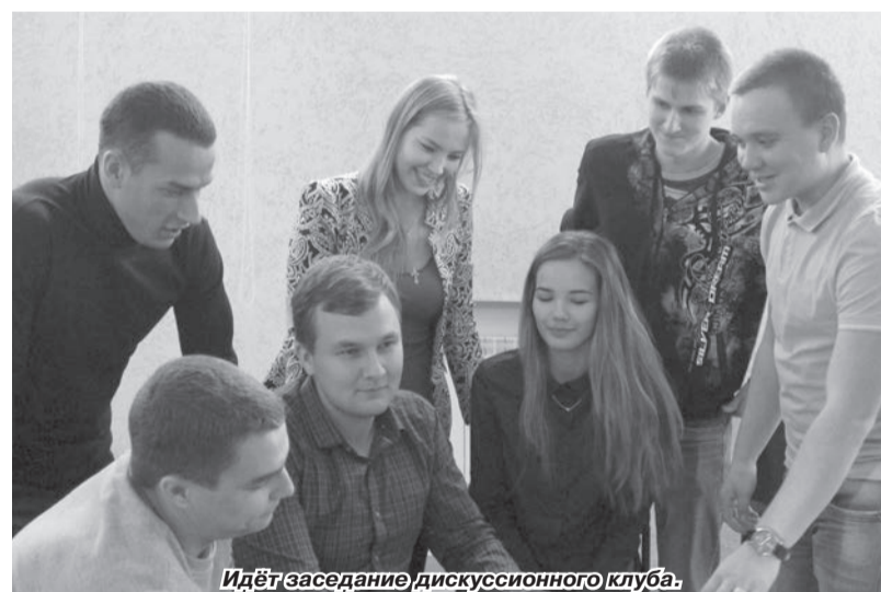
Идёт заседание дискуссионного клуба.

осуждаемое обществом, но ещё заснять это и выставить на всеобщее обозрение в Интернет?