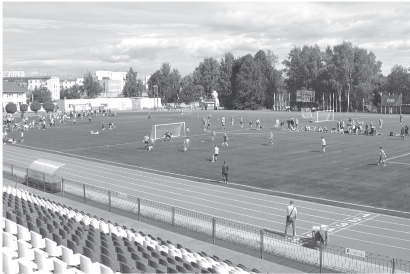
Спортивный праздник на стадионе «Энергия».

В ООО «Газпром трансгаз Чайковский» началось внедрение Всероссийского физкультурно-спортивного комплекса «Готов к труду и обороне» (ГТО).