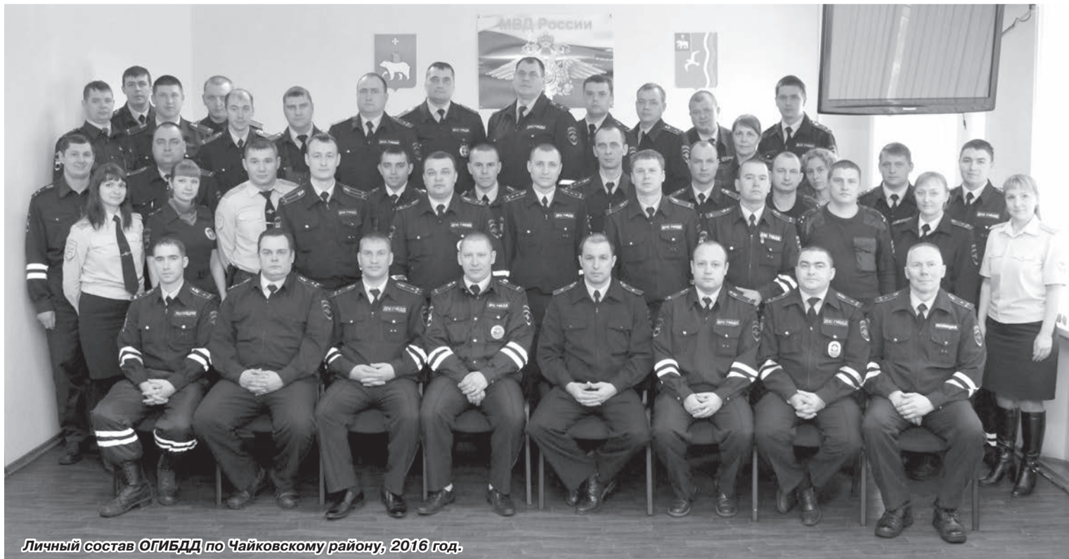
Личный состав ОГИБДД по Чайковскому району, 2016 год.