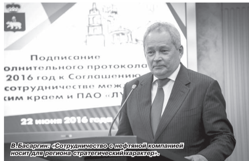
В Басаргин: «Сотрудничество с нефтяной компанией носит для региона стратегический характер».