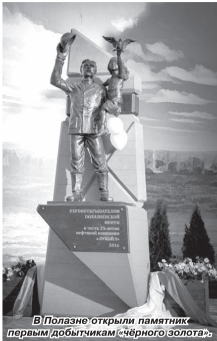
В Полазне открыли памятник первому добытчику «чёрного золота».

— Мы не сокращаем инвестиции в социальную сферу. Согла-