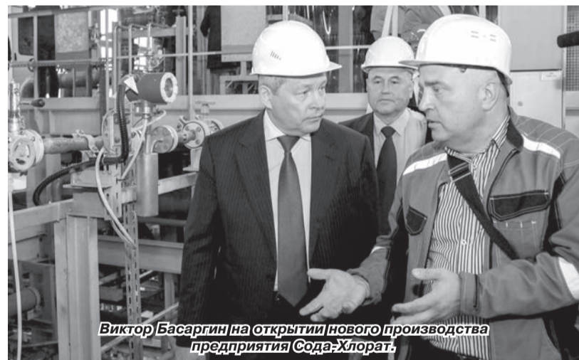
Виктор Басаргин на открытии нового производства предприятия Сода-Хлорат.

Если говорить о новациях – в этом году в Прикамье создали региональный фонд поддержки промышленности. Его основная цель – содействие в организации новых производств и обеспечении импортозамещения посредством предоставления льготных условий софинансирования проектов, направленных на разработку новой высокотехнологичной продукции, техническое перевооружение и создание конкурентоспособных производств на базе наилучших доступных технологий.