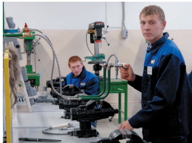
Исполнение производственных ситуаций на практике: работают будущие слесари-сантехники и слесари-монтажники.