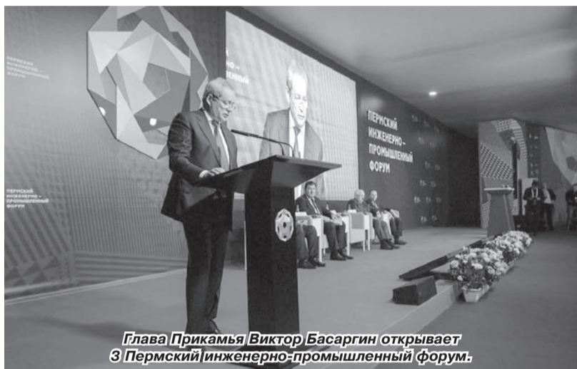
Глава Прикамья Виктор Басаргин открывает 3 Пермский инженерно-промышленный форум.

Сегодня развитие промышленности в Пермском крае – основной приоритет в работе губернатора и правительства. Наш регион стал первым в Российской Федерации, где начал работать механизм специального инвестиционного контракта, основные высокотехнологические рабочие места теперь создаются в производственной отрасли. Прорыв в промышленности Прикамья произошёл в том числе благодаря оперативному принятию региональной законодательной базы по развитию промышленной политики и разработке конкретных инструментов. О поддержке производственно-го сектора, новых рабочих местах и перспективах развития региона рассказывает губернатор Пермского края Виктор Басаргин.