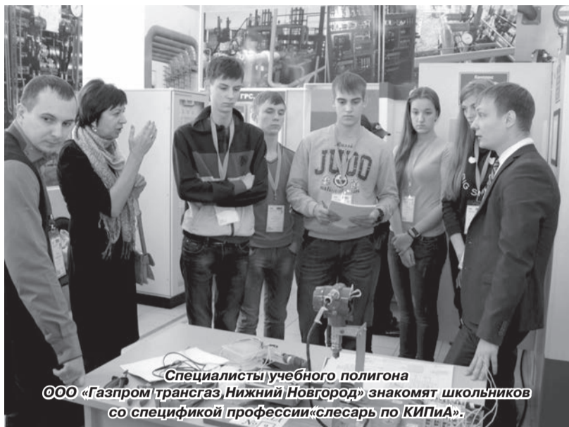
Специалисты учебного полигона ООО «Газпром трансгаз Нижний Новгород» знакомят школьников со спецификой профессии «слесарь по КИПиА».

В Нижегородской области прошёл первый ежегодный слёт учащихся «Газпром-классов», представлявших 18 дочерних обществ и организаций группы «Газпром».