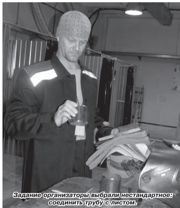
Задание организаторы выбрали нестандартное: соединить трубу с листом.

Второй муниципальный конкурс профессионального мастерства «Лучший электрогазосварщик» среди работающей и учащейся молодёжи Чайковского района состоялся на базе Многофункционального центра прикладных квалификаций техникума промышленных технологий и управления.