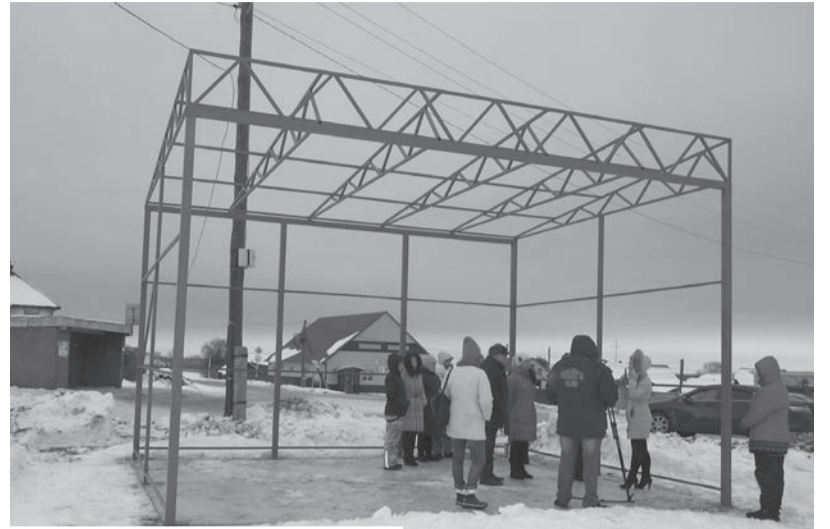
Будущая сцена на центральной площади Ольховки.

– Вы знаете, как нас много! Если мы все соберёмся... Нам места в