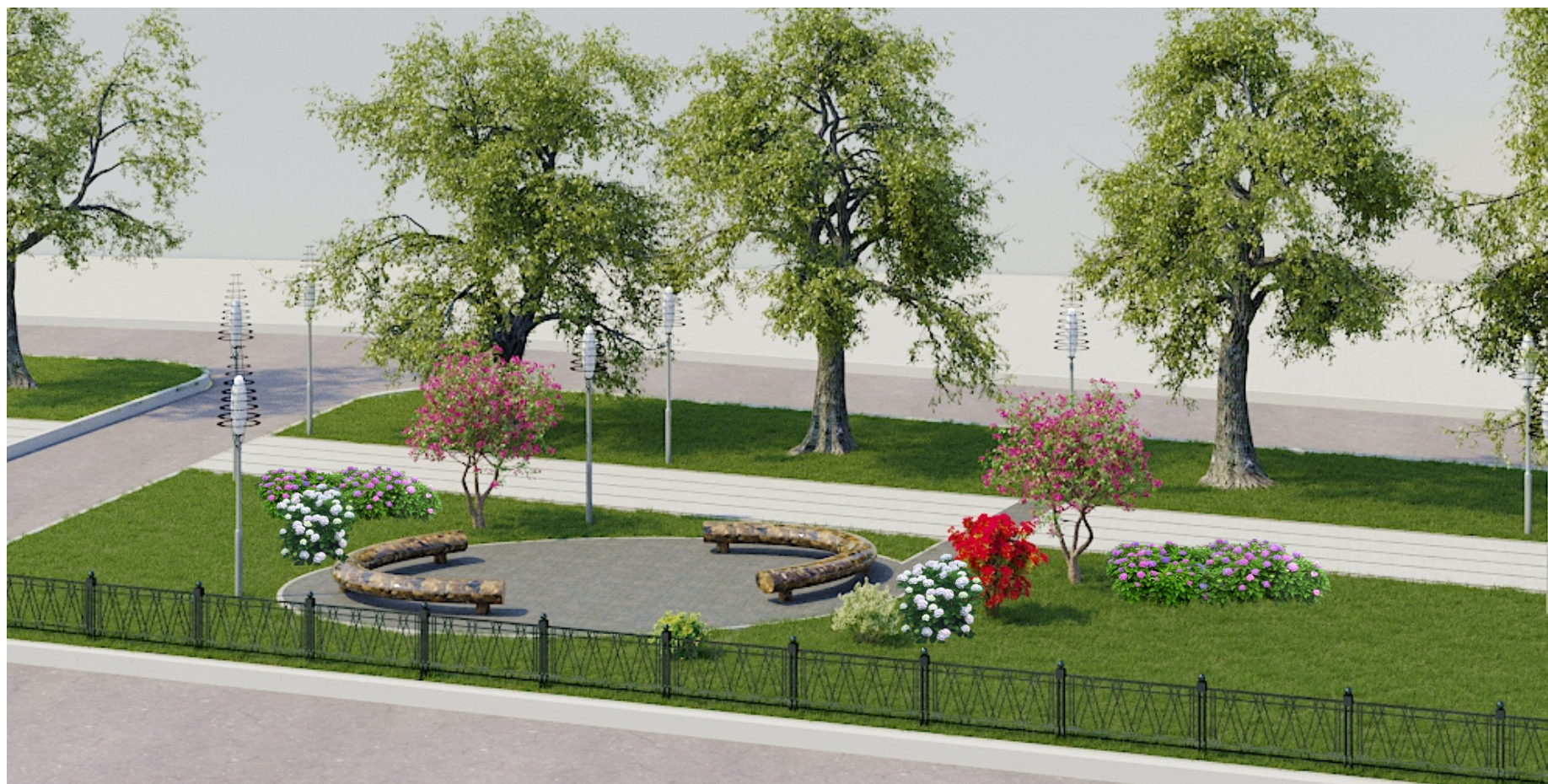
Зеленая зона. Размещение зон отдыха для пешеходов, устройство освещения, установка ограждения