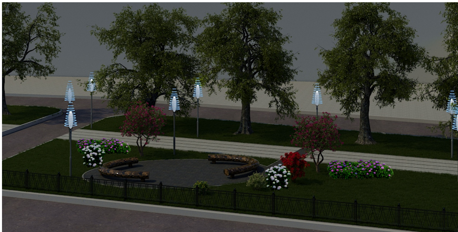
Зеленая зона. Размещение зон отдыха для пешеходов, устройство освещения, установка ограждения