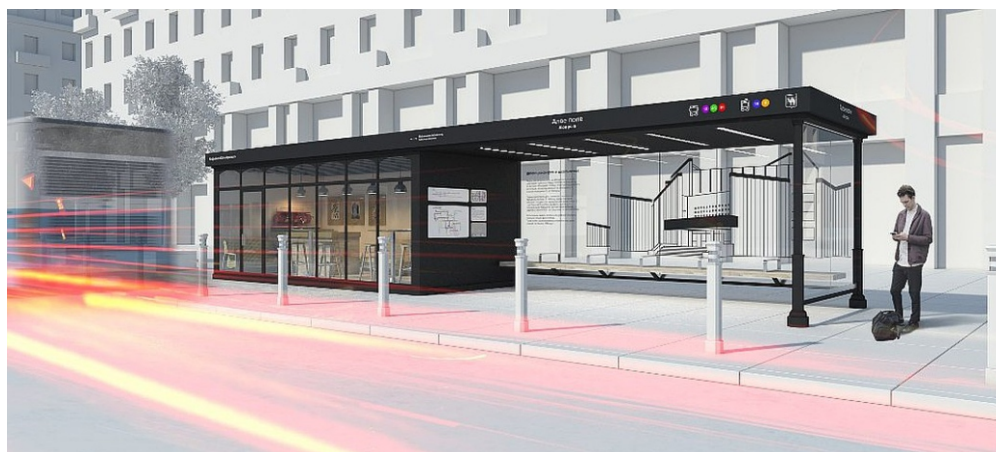
* Вариант остановочного комплекса