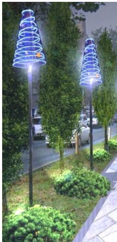
* Вариант светильников