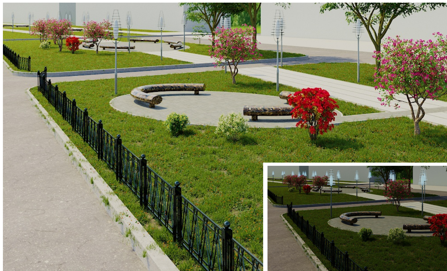
Зеленая зона. Размещение зон отдыха для пешеходов, устройство освещения, установка ограждения