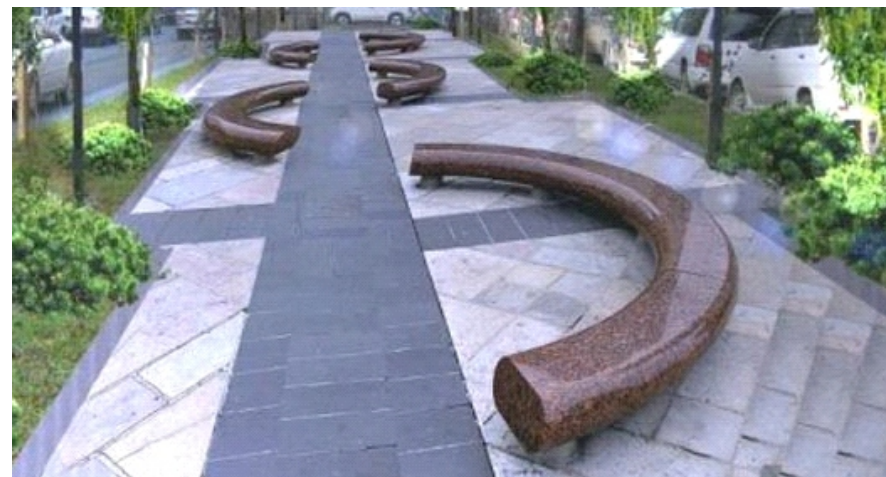
* Вариант покрытия пешеходных дорожек * Вариант скамеек