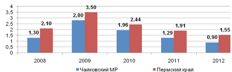
Уровень безработицы к экономически активному населению