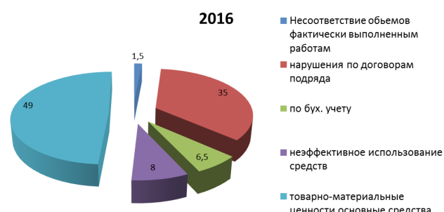
диаграмма 2 в %

Структура выявленных нарушений в процентном соотношении представлена на диаграмме 2.