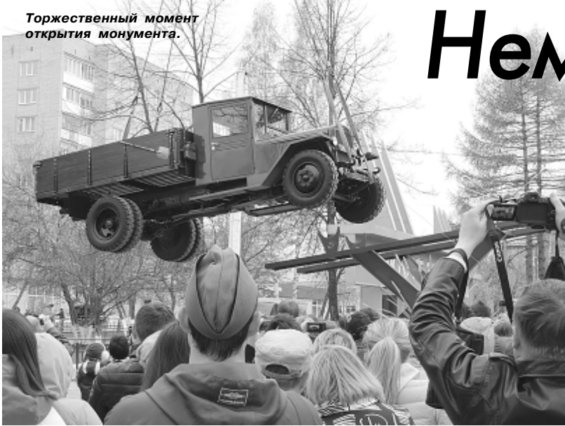
Торжественный момент открытия монумента.

Вечером 9 мая в сквере «Никто не забыт, ничто не забыто» состоялось открытие памятника героям войны и труженикам тыла.