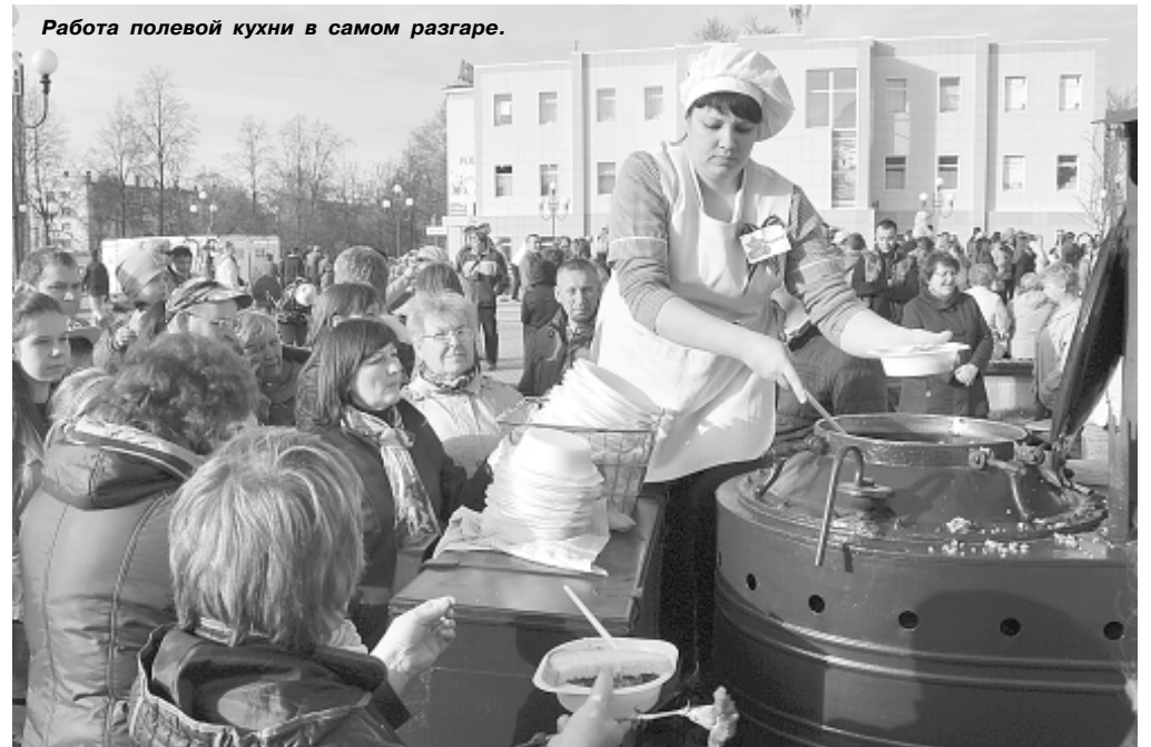
Работа полевой кухни в самом разгаре.