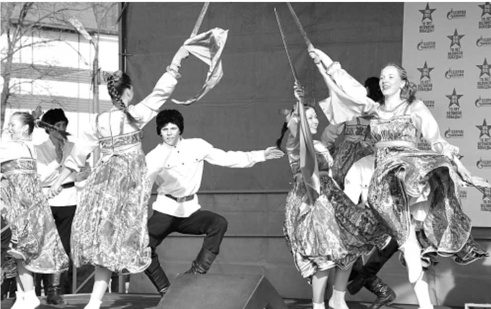
Выступают творческие коллективы КСЦ.

Более пятисот представителей ООО «Газпром трансгаз Чайковский» стали участниками Всероссийской акции «Бессмертный полк» в этом году. Второй год подряд работники Общества и ветераны предприятия вместе с членами своих семей принимают участие в этой акции. Согласно предоставленным заявкам, при поддержке профсоюза предприятия, всем желающим была оказана помощь в изготовлении штендеров.