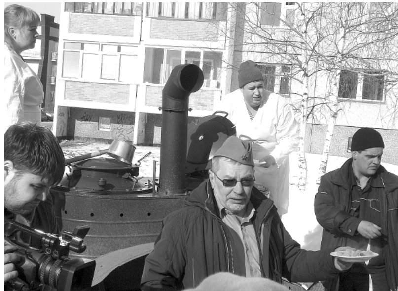
«Дымилась кухня полевая...».

– Родился я в 1926 году в деревне Лизинери близ города Чебоксары. В семье было 7 детей. Начало войны я встретил 15-летним подростком. Призвали меня в армию в 17 лет, в 1943 году. Рост мой был тогда 1,5 метра, а вес 46 кг. Сказалось голодное военное детство. Призывался я под Казанью, а военную подготовку проходил под Москвой. Учили нас прошедшие фронт комиссованные после ранения офицеры и сержанты. За три месяца мы научились стрелять из винтовки, автомата, станкового пулемета; поведению в атаке: 10-15 метров бежишь, затем падаешь, чтобы не оказаться на мушке у немца, перека-