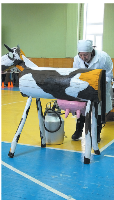
Доярка и её деревянная бурёнка.