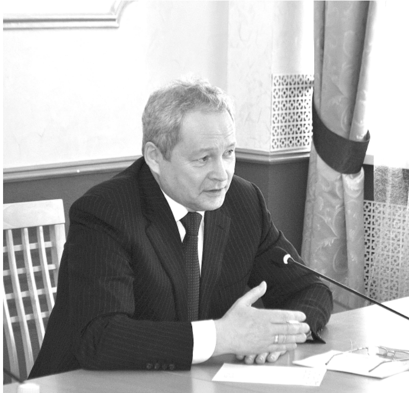
Выступает на совещании губернатор Прикамья Виктор Басаргин.

Скажу больше – что для нас развитие села – задача номер один. Ведь почти четверть населения края живет в сельской местности. Большинство из них связано с сельским хозяйством. Жизненная среда, как в городе, так и на селе, должна, безусловно, удовлетворять современное общество по качеству жизни, образованию и